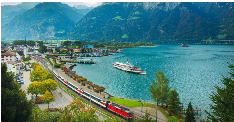
Gotthard Panorama Express_Flüelen1

Für die Rückreise machen wir es uns in der komfortablen 1. Klasse des Gotthard-Panorama-Express bequem und fahren auf der weltberühmten historischen Gotthard-Bahn über eine abwechslungsreiche Streckenführung und durch den Gotthard-Scheiteltunnel nach Flüelen am Vierwaldstättersee. Von dort bringt uns ein historisches Dampfschiff ( wenn eingesetzt ) in der 1. Klasse über den glitzernden See nach Luzern. An Bord nehmen wir ein gemeinsames Mittagessen ein. In Luzern steigen wir in einen Interregio, der uns nach Basel SBB bringt. Verabschiedung durch die Reiseleitung und individuelle Heimreise gegen 17.00 Uhr.