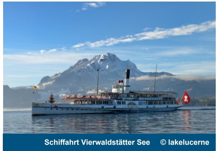
Schiffahrt Vierwaldstätter See

Bereits nach kurzer Fahrt mit dem Zug erreichen wir Melide am Damm durch den See. Nach einem Fußweg erreichen wir „Swissminiatur“, ein Park mit einer Darstellung der bedeutendsten Schweizer Gebäude und Transportmittel im Maßstab 1:25 eingebettet in eine wunderschöne Landschaft am Ufer des Luganer Sees, was eine „Reise durch die ganze Schweiz in nur einer Stunde“ ermöglicht und eine beliebte Attraktion für Familien ist, die die Schweiz im Kleinformat erleben möchten. Nach der Rückkehr in Lugano haben Sie nochmal die Möglichkeit Ihr Ticino Ticket ausgiebig zu nutzen, vielleicht sogar einen Abstecher auf den Monte Bre zu unternehmen. Ihr Reiseleiter berät Sie gerne dabei. Am späten Nachmittag trifft sich die Gruppe, um gemeinsam mit der Standseilbahn auf den Monte San Salvatore zu fahren. Das Wahrzeichen des Tessins zeichnet sich auch durch eine beeindruckende 360 Grad Rundumsicht aus. Vom Luganer See, über die Alpen bis zu den Apenninen. Beim gemeinsamen Abendessen im Panoramarestaurant lassen wir den Abend ausklingen.