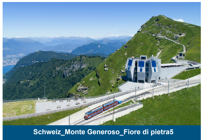
Schweiz_Monte Generoso_Fiore di pietra5