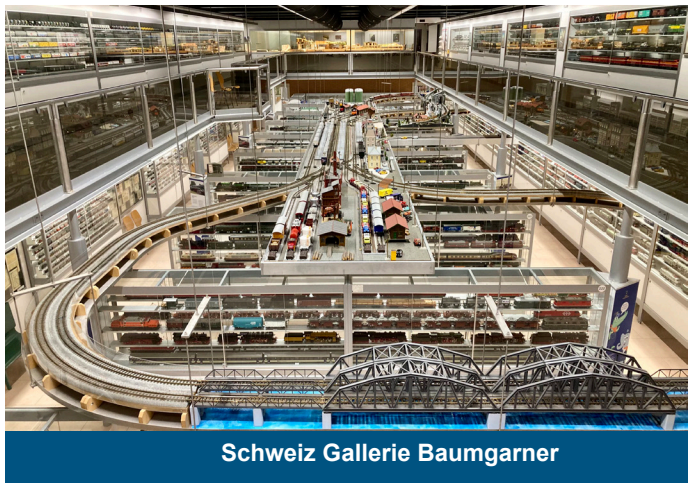
Schweiz Gallerie Baumgartner