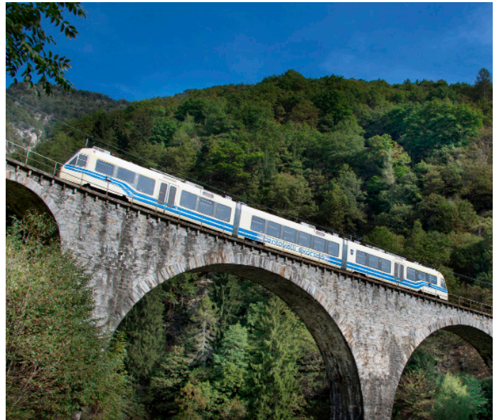
Ferrovia Vigezzina- Centovalli

Wir beginnen den Tag mit der Bahnfahrt von Lugano Paradiso nach Locarno. Anschließend fahren wir mit der Standseilbahn zur Wallfahrtskirche Madonna del Sasso hinauf. Die Bahn zeichnet sich durch eine elegante, weitgehend dem Bach Ramogna folgende Linienführung aus. Die von der Firma Von Roll stammende Standseilbahn mit Abt'scher Weiche weist qualitätvolle Kunstbauten wie die sorgfältig aus Steinquadern gefügte Bogenbrücke oder die Stahlfachwerkbrücke über die Ramogna auf. Eindrücklich sind auch die in eine städtische Häuserzeile integrierte Talstation und die spätklassizistische, von der Wiener Sezession inspirierte Bergstation. Auf der bemerkenswert in die Landschaft eingefügten Linie verkehren Fahrzeuge mit formschönen, zeittypischen Karosserien von 1958. Nach einem Aufenthalt an der Wallfahrtskirche Madonna del Sasso fahren wir weiter zur Bergstation Orselina und mit einer Luft-