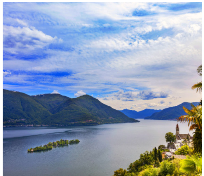
Locarno Ronco sopra Ascona