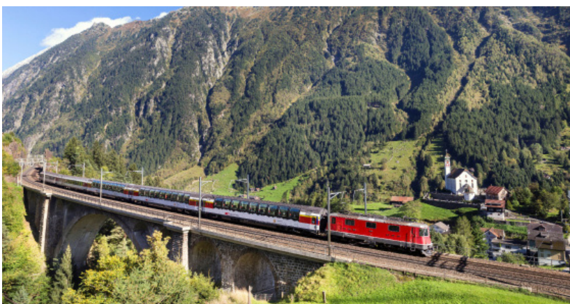
Schiffahrt Vierwaldstätter See